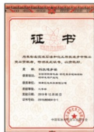
中国石油和化学工业科技进步奖