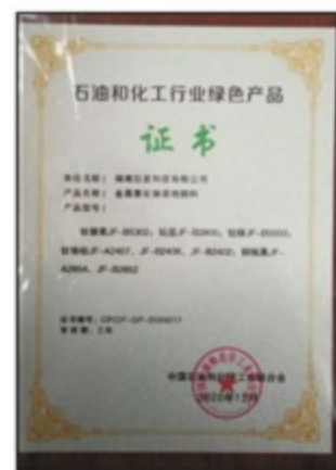
石油和化工行业绿色产品证书