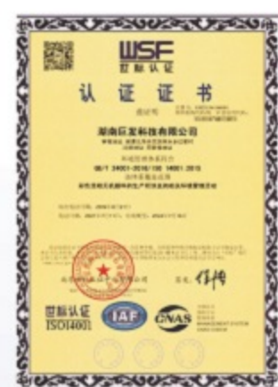
ISO14001:2015 环境管理体系认证证书