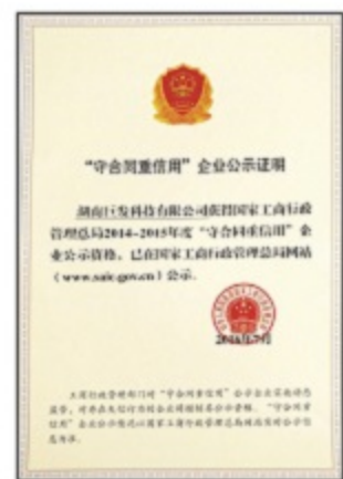
国家级守合同重信用企业