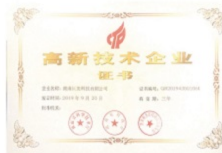
国家高新技术企业