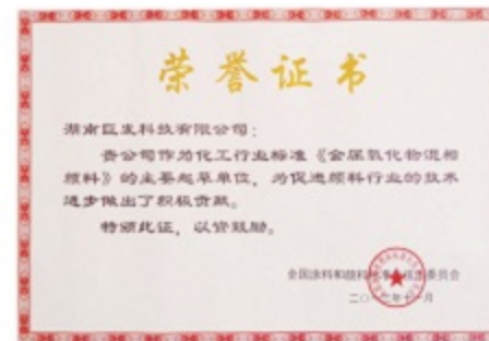
国家行业标准主要起草单位荣誉证书