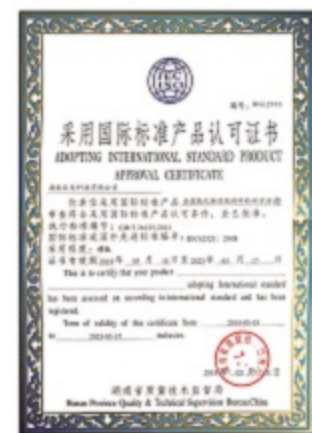
采用国际标准产品认可证书