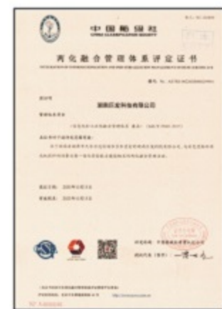
两化融合管理体系评定证书