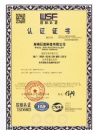
ISO9001:2015 质量管理体系认证证书