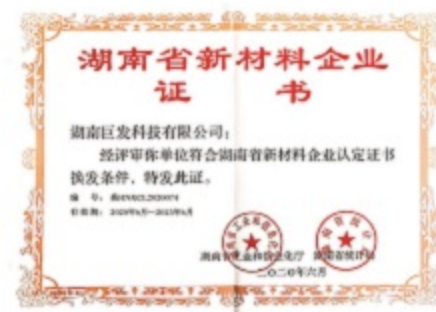
湖南省新材料企业证书