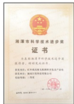
湘潭市科技进步奖