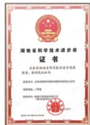
湖南省科技进步奖